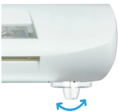
ZFHV 5-35 / ZFHVA 5-35

Reinigen Sie die Oberfläche mit einem normalen Staubtuch.