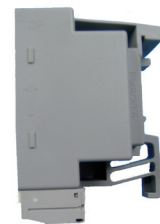
Trafo 0,2A / Trafo 1A