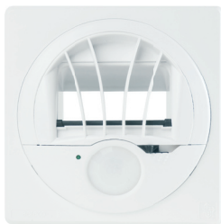
ABI 100 / 12V