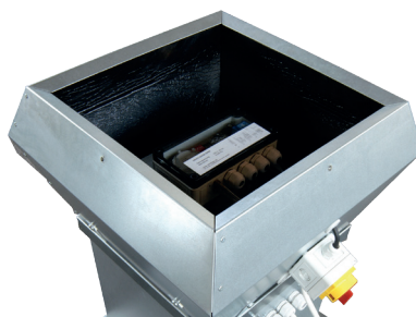
Das Druckregelmodul befindet sich im Motorgehäuse und ist werkseitig montiert