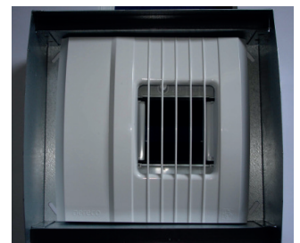
Das Abluftelement wird hinter dem Filter im Gehäuse eingesetzt.