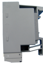
Bild: Trafo 0,2A / Trafo 1A Seitenansicht