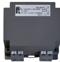
Bild: Trafo 3A Frontansicht