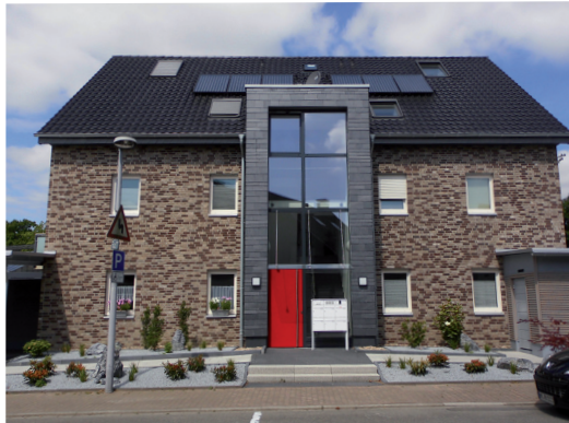
Dieses Mehrfamilienhaus aus Mülheim an der Ruhr besteht aus 6 Wohneinheiten.