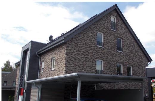
In den Schlaf- und Wohnräumen wurden die Außenluftdurchlässe ZWRH 30 am Rollladenkasten eingesetzt. Von Außen sind die Luftdurchlässe nicht sichtbar.

Dieses Mehrfamilienhaus mit 6 Wohneinheiten (Gebäudenutzfläche: 595 m 2 ) wurde 2014 fertiggestellt. Es wurde nach dem KfW-EH 70 Standard geplant und ausgeführt: Der berechnete Jahres-Primärenergiebedarf q_p liegt bei 42,29 kWh/m 2 a (EnEV-Anforderung nach Referenzgebäude: 60,59 kWh/m 2 a).