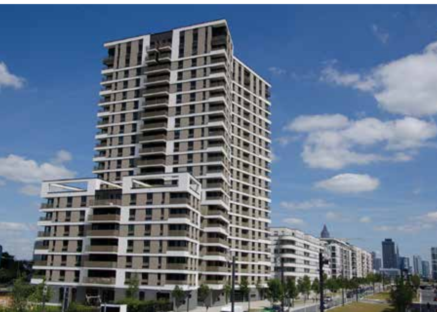
Das 66-Meter hohe Hochhaus Westside Tower bildet das Eingangsportal zum Neubaugebiet „Europaviertel“ in Frankfurt am Main.