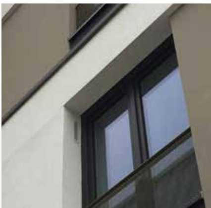
Wand-Außenluftdurchlässe sorgen dank Feuchteführung und hoher Schalldämmung für einen verbesserten Wohnkomfort der Nutzungseinheit.

durchlässe zum Einsatz. Hier wurden Außenluftdurchlässe ausgewählt, dessen Flachkanäle im Wärmedämmverbundsystem eingebaut wurden. Die Ansaugung ist dank der lackierten Gitter in der Fensterlaibung von der Straße so gut wie unsichtbar.