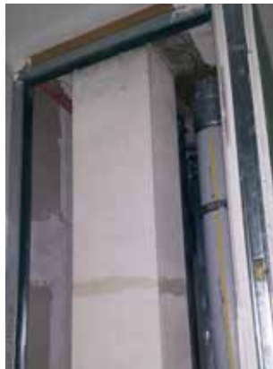
Brandschutzkanalsystem mit Klassifizierung K90-18017 S

Die zuvor beschriebenen Abluftelemente werden mittels einer Strangleitung an die Lüftungsgeräte (Typ Aereco DVSA-A) angeschlossen. Hierzu befinden sich mehrere EC-Lüftungsgeräte auf dem Dach. Die Strangleitung wurde im oben beschriebenen Bauvorhaben mit Hilfe des Brandschutzkanalsystems Ventisafe ausgeführt. Steigleitungen können als Stahlblechleitung (Wickelfalzrohr) oder als Schachtsystem in F90-Ausführung realisiert werden. Das Kanalsystem Ventisafe verfügt über eine Systemzulassung nach DIN 18017-3 und ist daher nicht abnahmepflichtig. Es besteht aus Kalzium-Silikat. Aufgrund der Systemzulassung bis 1.000 cm 2 freie Querschnittsfläche bietet es gegenüber dem Wickelfalzrohr-System deutliche Vorteile in Bezug auf die Luftmengen. So können an einem Kanal bis zu 36 Abluftelemente bei einem Auslegungsvolumenstrom von 50 m 3 /h angeschlossen werden. Flexible Gestaltung der Abmessungen insbesondere bei der Schachtplanung sind ein weiterer Vorteil. Da die Abschottung mittels Absperrvorrichtung direkt am Schachteingang erfolgt, kann die Positionierung des Abluftelements an der Schachtwand auch kurzfristig und frei bestimmt werden.