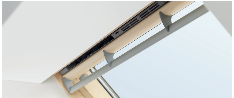
Verdeckter Außenluftdurchlass ZOH im VELUX-Holzfenster

Einfache Montage Auch nachträglich zu montieren