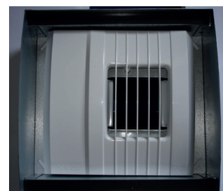
Das Abluftelement wird hinter dem Filter im Gehäuse eingesetzt.