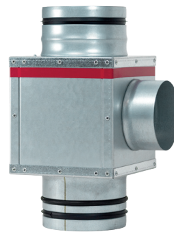
RSG RM xxx